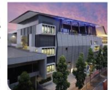
Brisbane Convention and Exhibition Centre

The Australian Government, Queensland Police Service, Brisbane City Council and the Department of Transport and Main Roads are working together to minimise disruption to