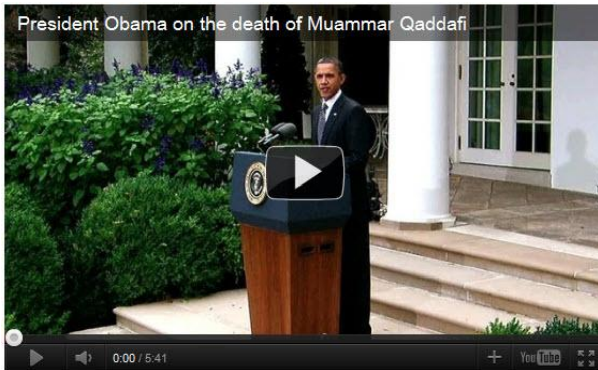
The White House - President Obama's Remarks on the Death of Muammar el-Qaddafi

“Esto marca el fin de un largo y penoso capítulo para el pueblo de Libia, que ahora tiene la oportunidad de decidir su propio destino en una nueva y democrática Libia”, ha declarado Obama en una conferencia ante los periodistas pocas horas después de que se confirmase la muerte de Gaddafi. “La revolución ha triunfado”, ha certificado. Leer más