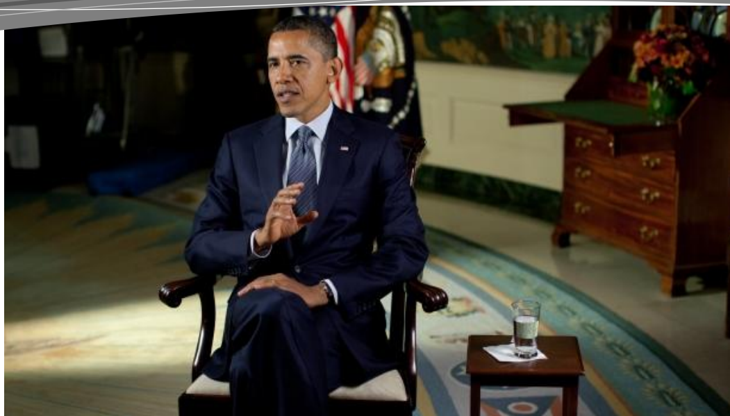
Official White House photo, 2/1/0/11