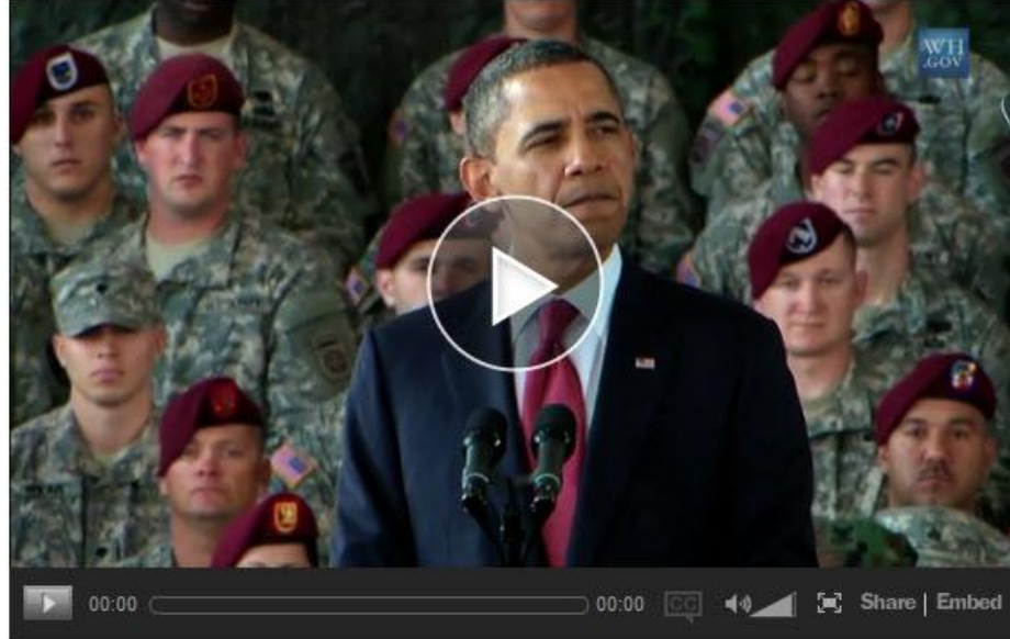
The White House - President Obama at Fort Bragg: "Welcome Home"

Como secretario de Defensa, Leon E. Panetta marcó la ocasión con un discurso en un patio fortificado de hormigón en el aeropuerto de Bagdad, mientras helicópteros sobrevolaban por encima, lo que subraya los desafíos que enfrenta un país donde los insurgentes continúan atacando a los soldados americanos y donde los militantes de Al Qaeda todavía periódicamente llevan a cabo ataques devastadores contra civiles. Leer más