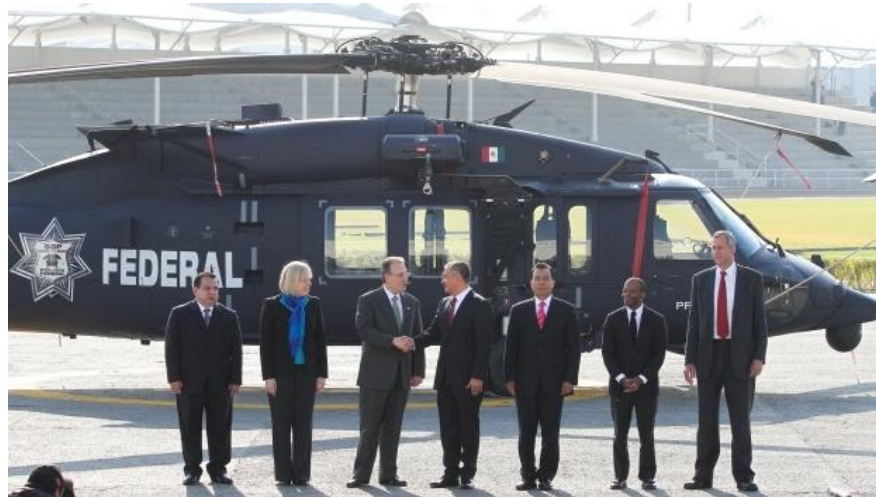
Estados Unidos entregó a la Secretaría de Seguridad Pública federal un helicóptero Black Hawk.

A su vez recordó que a pesar de las críticas al Plan Mérida, la iniciativa seguirá vigente. Leer más.