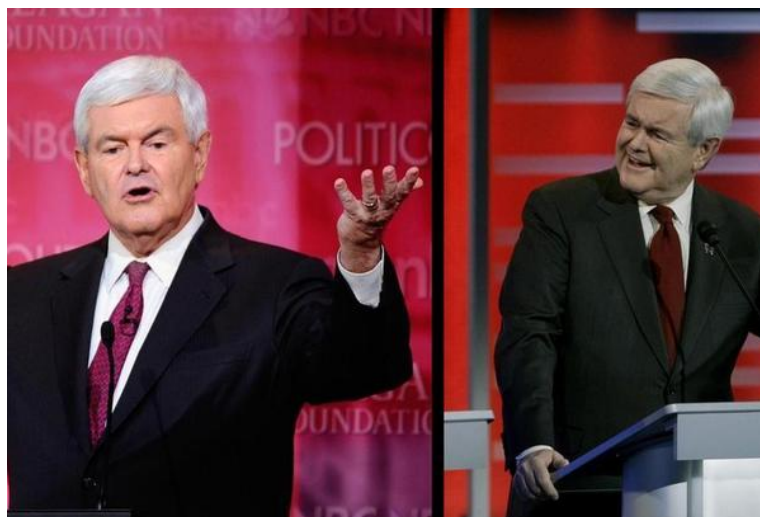
GOP presidential candidate Newt Gingrich

Las encuestas de la NBC News y el Wall Street Journal, AP / GfK y Reuters / Ipsos muestran que el ex gobernador de Massachusetts, Mitt Romney, viene mejor posicionado que Gingrich para enfrentarse contra Obama en las elecciones generales. Leer más