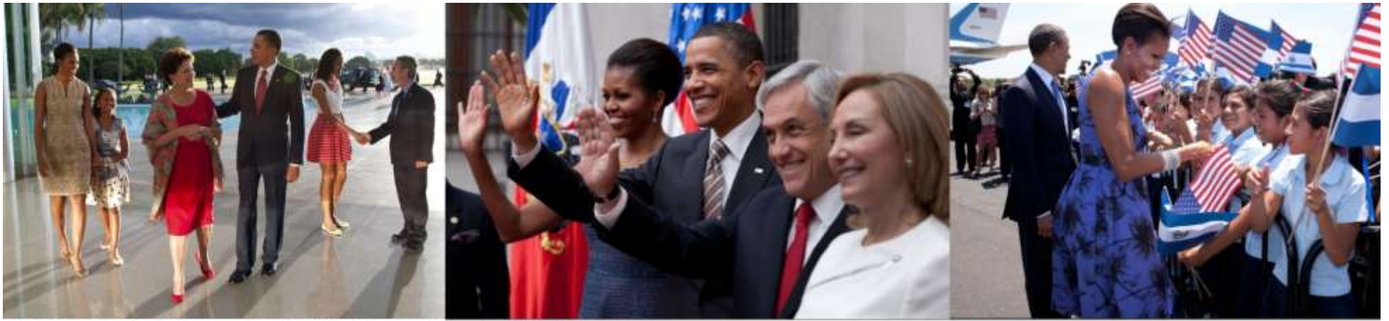
Visita oficial del presidente Barack Obama a Brasil, Chile y El Salvador. Marzo 2011.