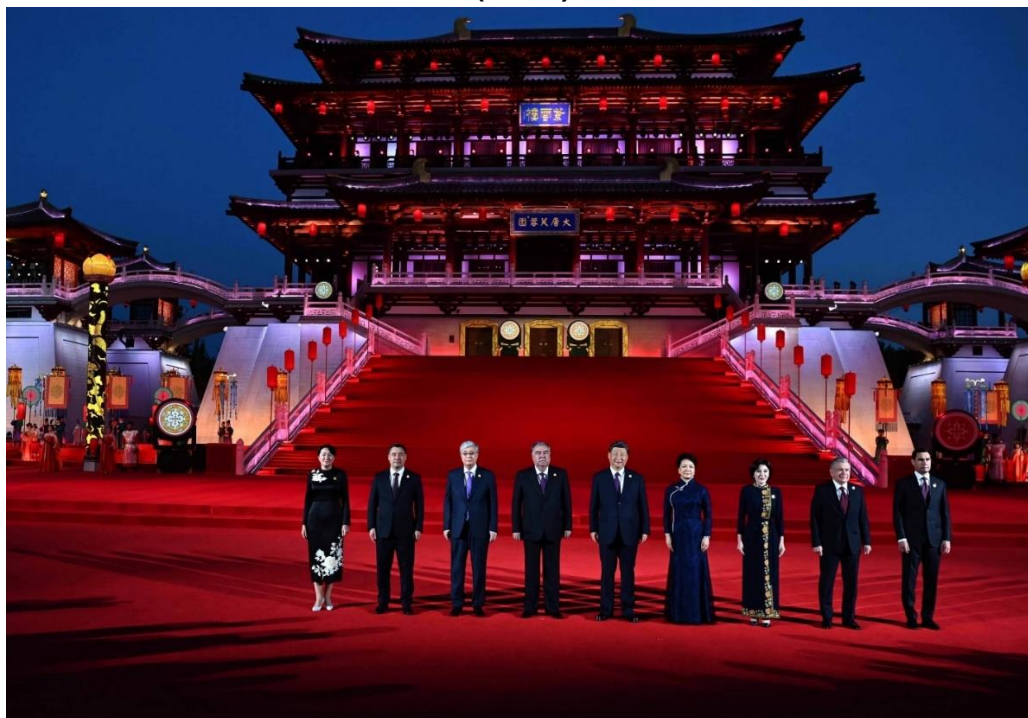
Figura N° 4 – Ceremonia de agasajo a los participantes en el “Templo del Loto” (Xi’an)