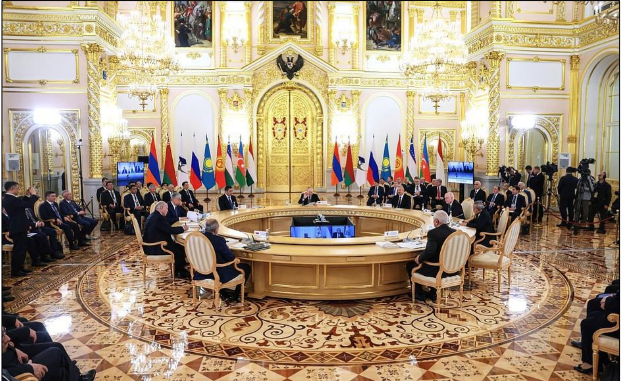
Figura N° 9 – Cumbre del Consejo Supremo de la Unión Económica Euroasiática