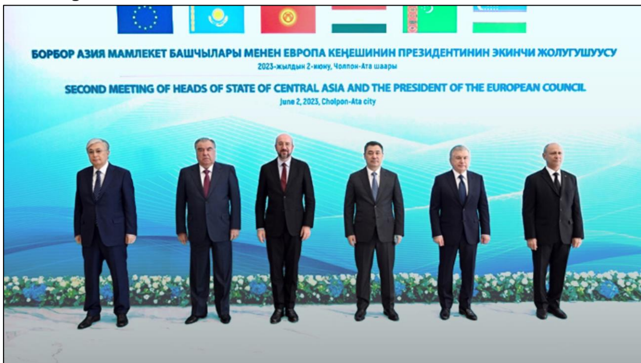
Figura N° 6 – Reunión Cumbre de Jefes de Estado UE – Asia Central