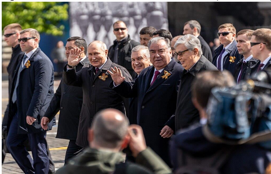
Figura N° 8 – Celebración del “Día de la Victoria” (Moscú 2023)