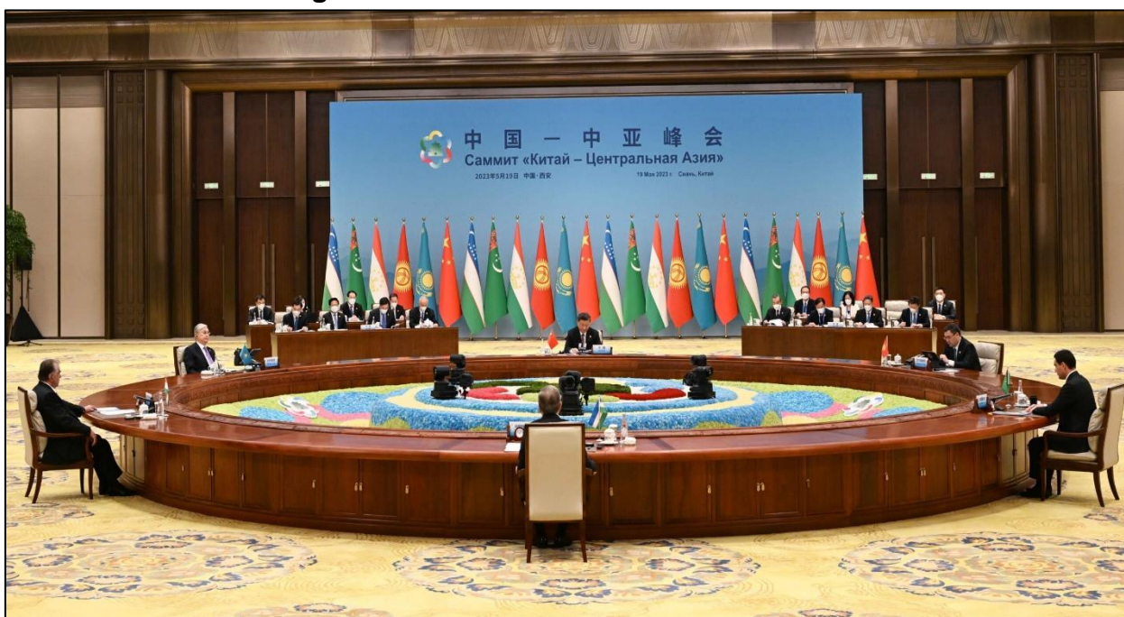
Figura N° 5 – Cumbre China-Asia Central