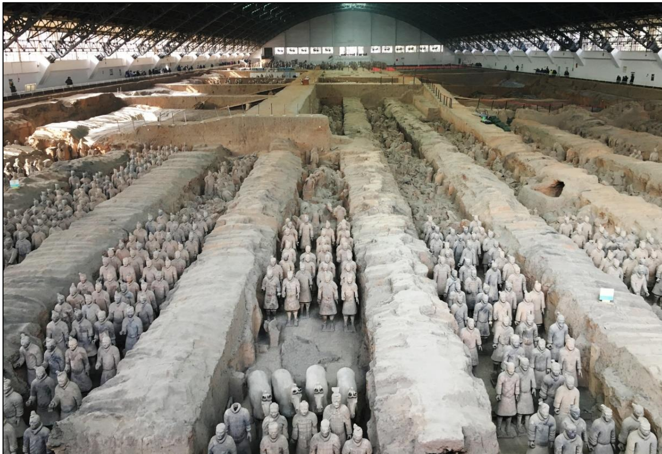
Figura N° 2 – “Ejército de Terracota” (Xi'an)