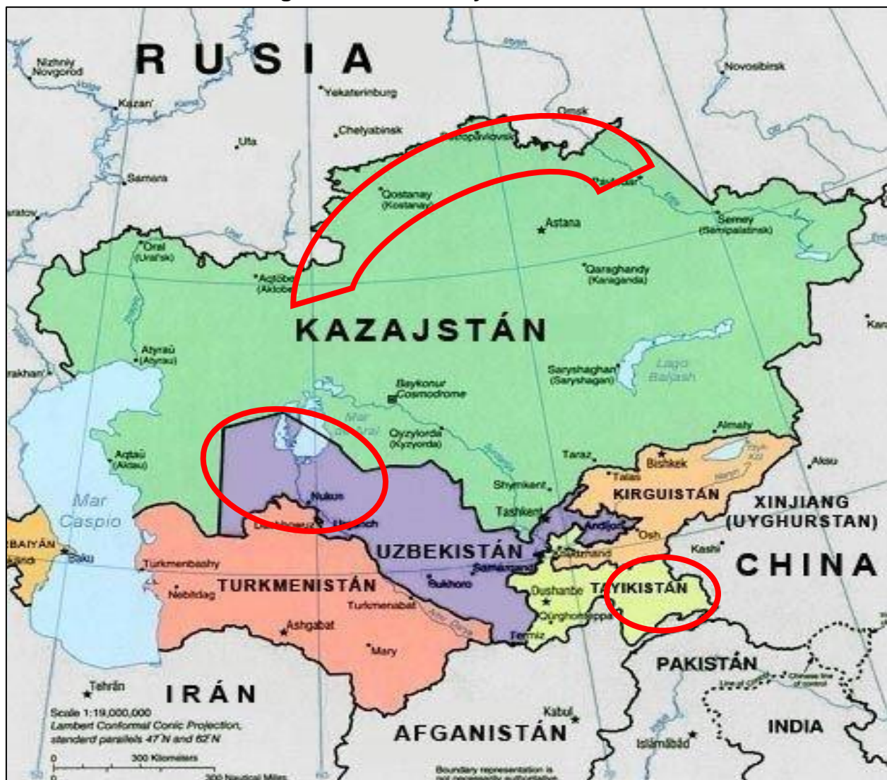
Figura N° 3 – China y Asia Central.