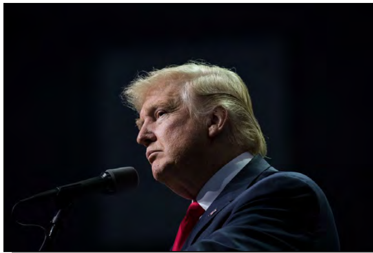
Donald Trump