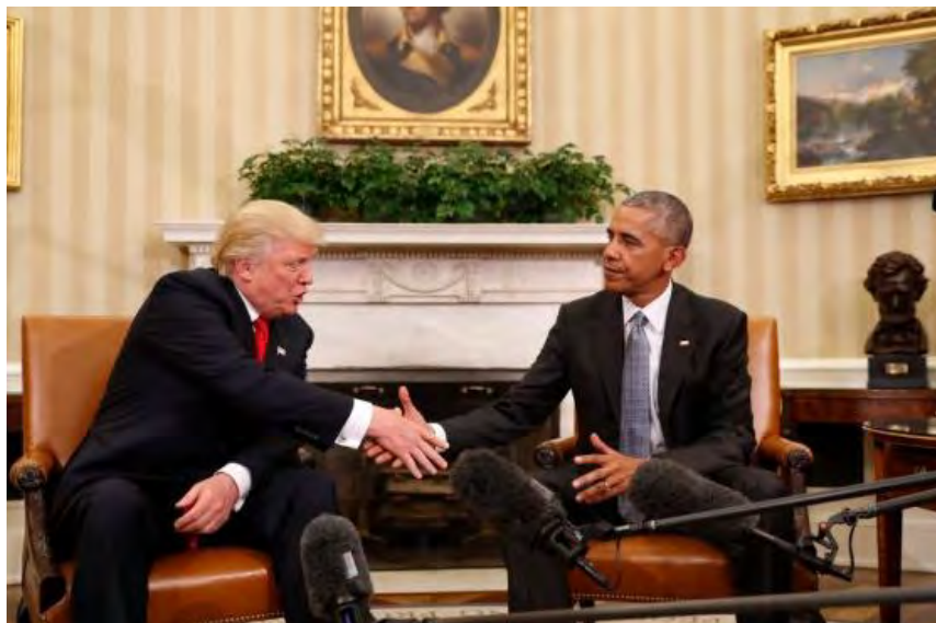
Donald Trump y Barack Obama reunidos en la Oficina Oval de la Casa Blanca el 10 de noviembre | Fuente: The Press Enterprise

El presidente electo Donald Trump y el presidente Barack Obama se reunieron por primera vez el jueves 10 de noviembre en la Casa Blanca. El empresario dijo que le tiene gran respeto al presidente Obama. Leer más.