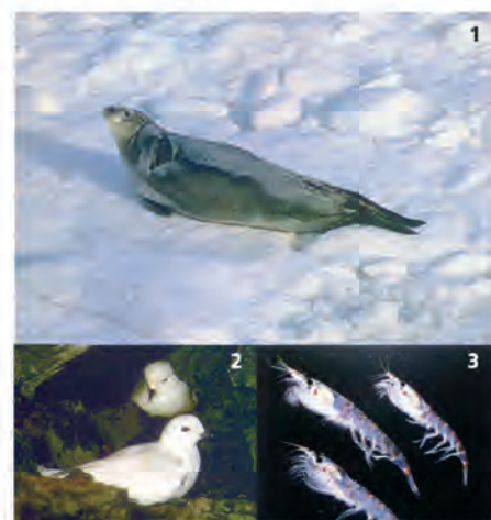
Fauna autóctona antártica: 1 Elefante marino 2 Petreles blancos 3 Krill