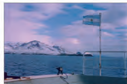
Vista de la costa desde la popa del buque argentino de investigación pesquera Dr. Eduardo L. Holmberg.

● Ubicación de las bases argentinas (El mapa debe ser utilizado para referencia solamente)