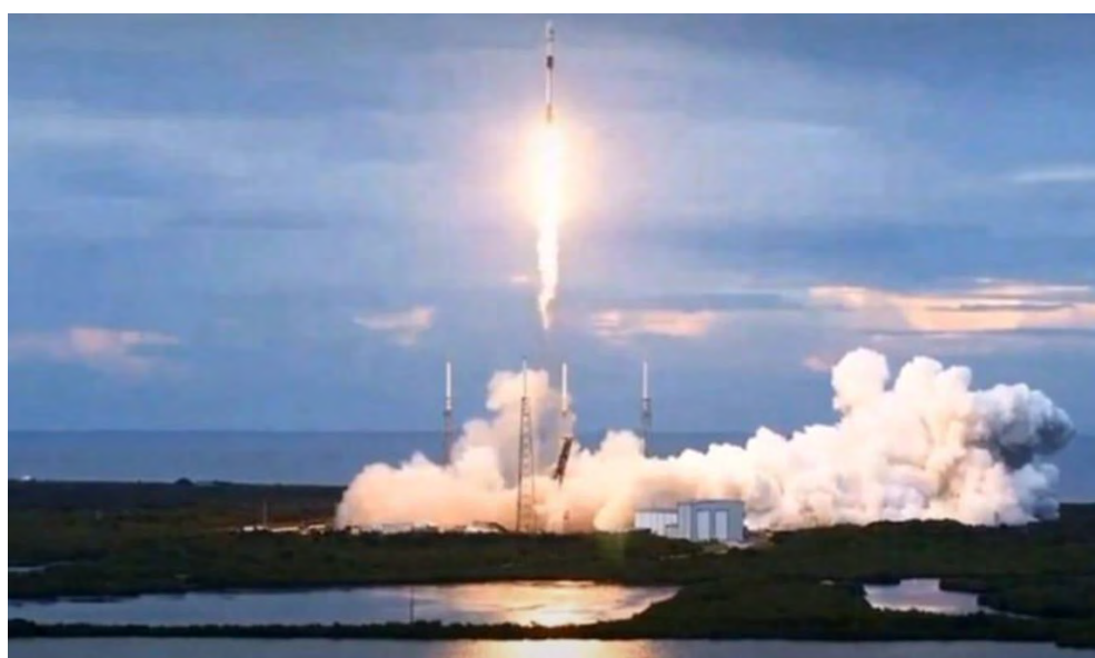
Lanzamiento del satélite SAOCOM 1B

Sin embargo, los beneficios del lanzamiento de SAOCOM-1B trascienden estos logros. En un momento en que las personas de todo el mundo comparten una gran incertidumbre impulsada por la pandemia, logros inspiradores como estos mejorar las condiciones de vida, hacer crecer las economías y conservar nuestro medio ambiente global- son aún más importantes. Las innovadoras colaboraciones entre países, gobiernos, empresas e individuos que hicieron posible este satélite y su lanzamiento, reafirman que, trabajando juntos, se pueden superar incluso los desafíos más difíciles.