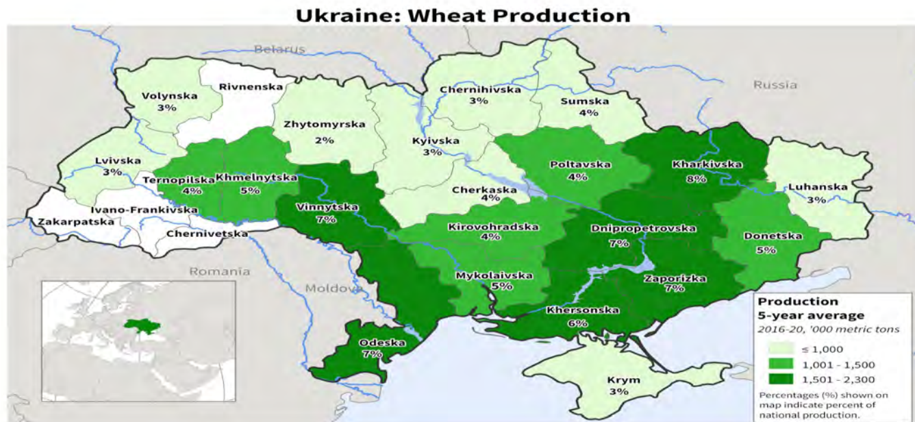
Figura N° 3. Áreas de cultivo de trigo, maíz y girasol en Ucrania

USDA Foreign Agricultural Service U.S. DEPARTMENT OF AGRICULTURE