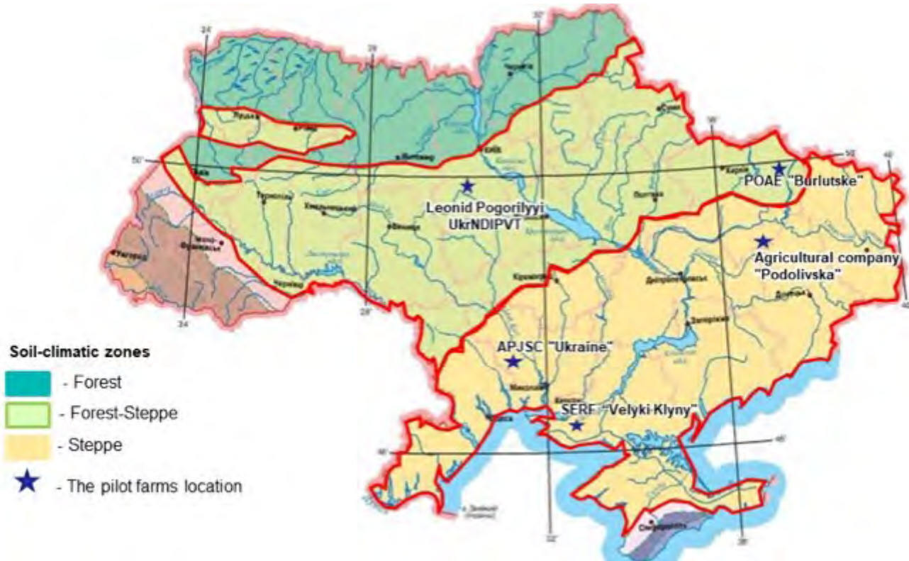
Figura N° 1. Tipos de Suelos en Ucrania