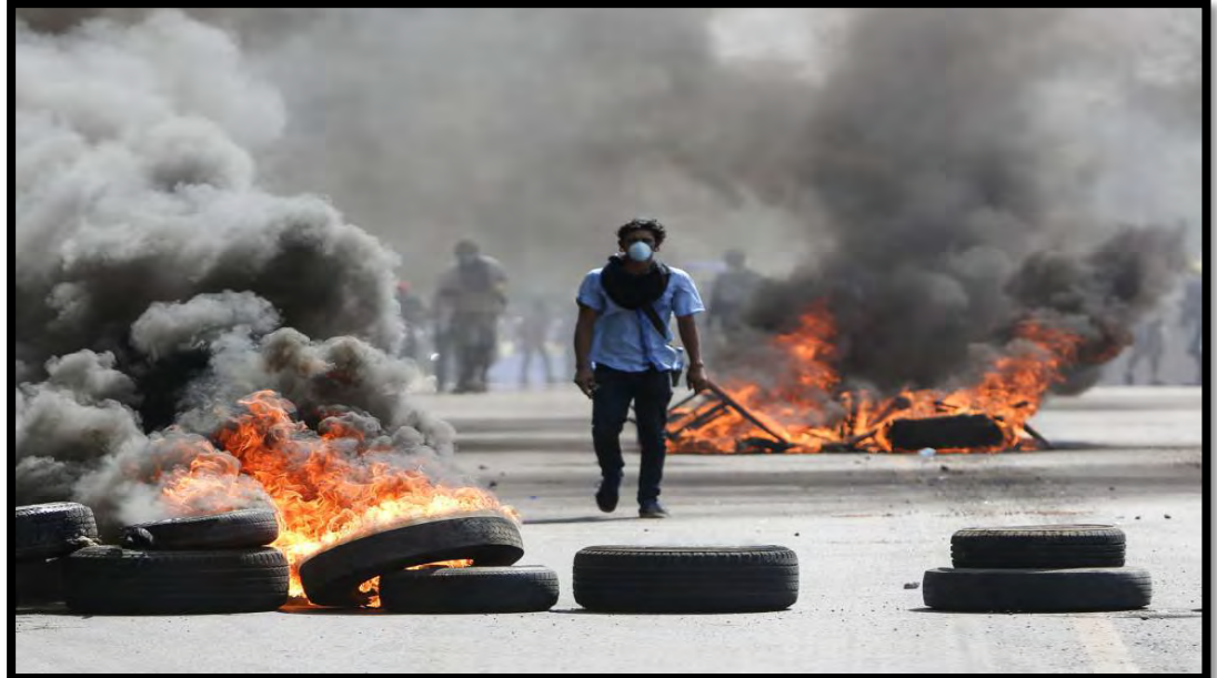
Un manifestante camina entre barricadas en Managua.