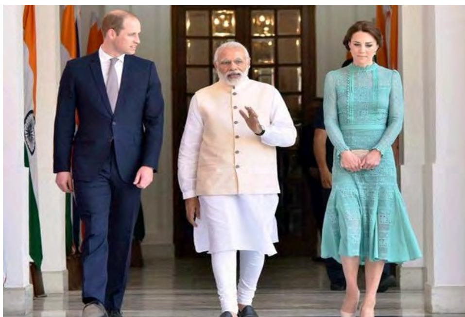
El Príncipe Guillermo, el Primer Ministro Modi y La Duquesa de Cambridge. Fuente: The Hindu (12 de abril)

Ha habido numerosas visitas oficiales a la India por parte de la corona británica. La reina la visitó en 1961 y el Príncipe Carlos lo hizo 8 veces, mientras el Príncipe Andrés lo hizo una vez. Bután en cambio, recibió dos visitas de miembros de la corona británica antes que esta: la del Príncipe Carlos en 1998 y la del príncipe Andrés en 2010.