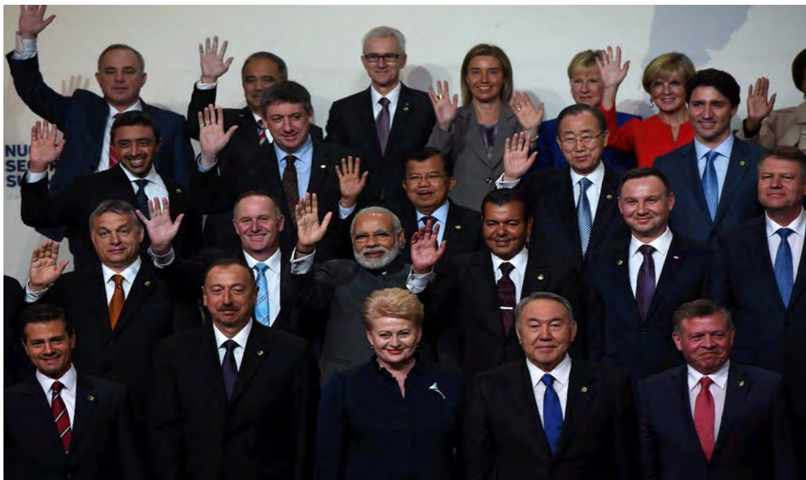
El Primer Ministro Modi con otros líderes mundiales que concurrieron a la Cuarta Cumbre sobre Seguridad Nuclear, en la ciudad de Washington.

Luego de su partida de Estados Unidos, el Primer Ministro Modi se dirigió a Riyad, Arabia Saudita, para una visita de dos días. Esta constituyó la segunda visita de Modi a un estado miembro del Consejo de Cooperación del Golfo (CCG), lo cual indica un cambio en la política más amplia de la India hacia Asia occidental. Su visita, que busca elevar el perfil político de la India en la región, complementa otras visitas de alto nivel ministeriales a países como Omán, Bahrein y los Emiratos Árabes Unidos.