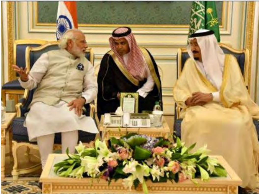
El Primer Ministro Modi y el Rey Salman bin Abdul Aziz Al-Saud.