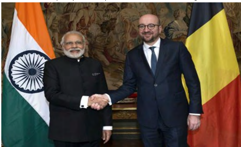
El Primer Ministro Narendra Modi saluda a su par belga, Charles Michel, en ocasión de su encuentro en Bruselas, el 30 de marzo.

Hubo también un almuerzo con CEOs y líderes de negocios, seguido por la activación remota del telescopio de India-Bélgica AIREs (Aryabhata Instituto de Investigación para las Ciencias Observacionales), el telescopio óptico completamente orientable más grande de Asia.