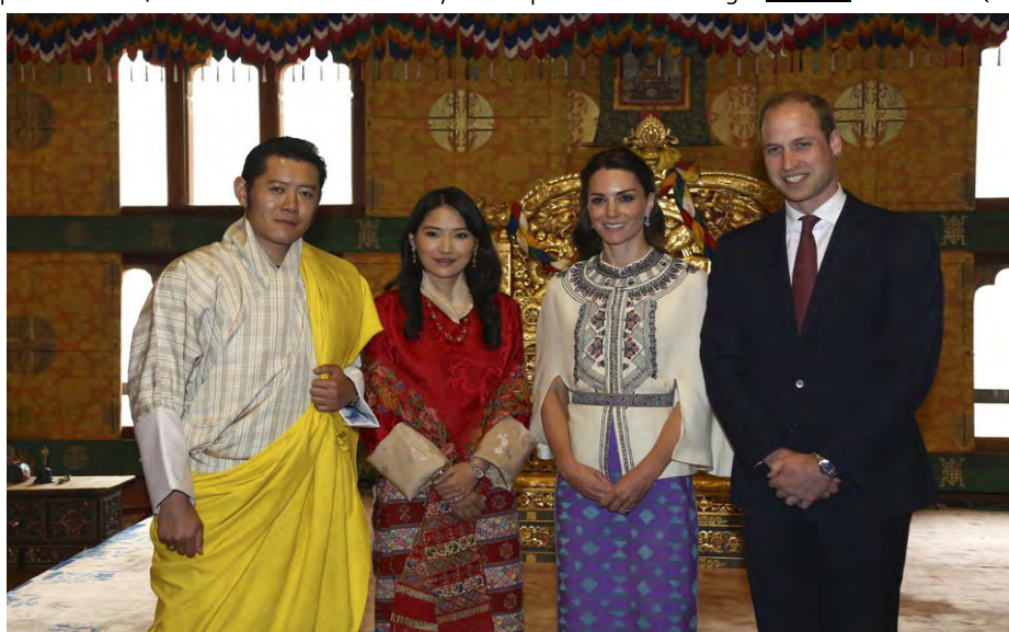
El Rey de Bután, Jigme Khesar Namgyel Wangchuk; la reina, Jetsun Pema; la Duquesa de Cambridge y el Príncipe Guillermo.